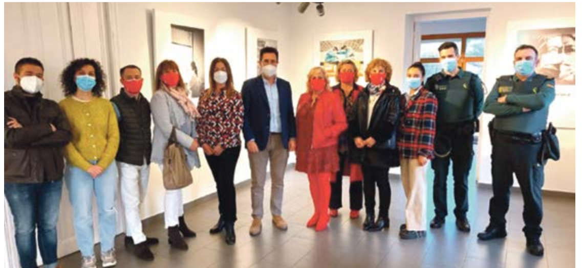
Presentación de la exposición "Miradas Enfermeras de la pandemia" en Colindres.