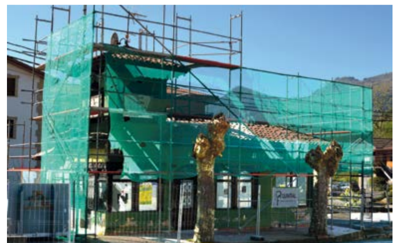
Viejo Bazar-Platería de Rucoba, será acondicionado como centro de ocio.

Con una histórica y antigua presencia en el municipio, el edificio del viejo Bazar-Platería en el barrio de Rucoba en Limpías, estará destinado a centro juvenil y de ocio para jóvenes. Para realizar la obra se cuenta con una subvención de la Dirección de Cultura del Gobierno de Cantabria que asciende a aproximadamente 48.000 euros.