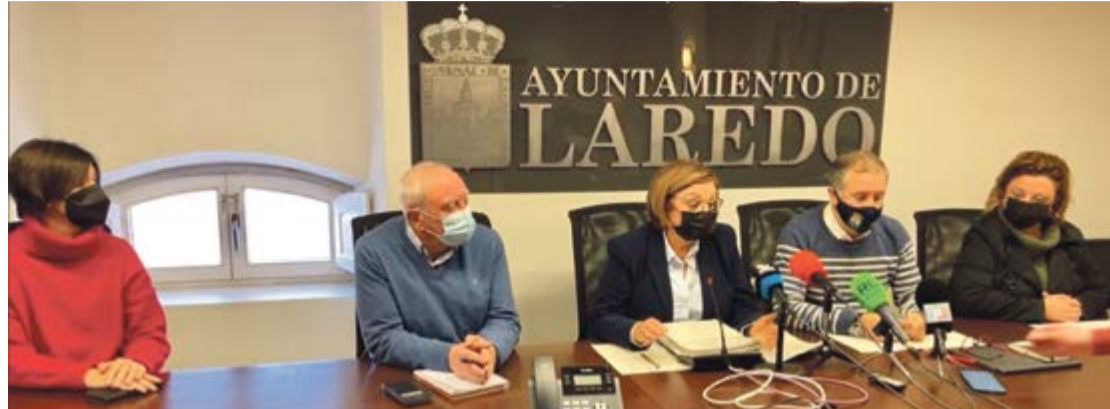
El actual equipo de gobierno pejino en la comparecencia pública.

La ejecución de la rebaja fiscal se aprobó definitivamente en marzo de 2021 pero se ejecutó retroactivamente en enero de 2021, lo cual no era factible. El equipo de gobierno de Laredo propuso en noviembre de 2020 una rebaja de impuestos para paliar los efectos de la crisis del COVID-19. Ayer, el equipo de gobierno pejino ha recibido un informe del área económica del Ayuntamiento, constituida por el Tesorero y el Interventor del consistorio, en el que se le ha informado sobre defectos de forma en la tramitación y defectos de fondo en la aplicación de las medidas impulsadas para la rebaja de impuestos impulsada por mandato de la entonces concejala