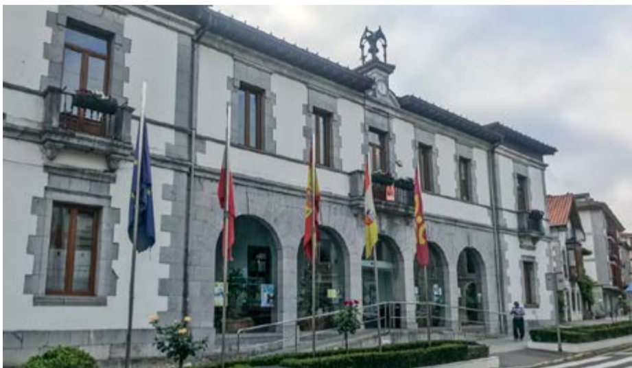
Ayuntamiento de Rames de la Victoria