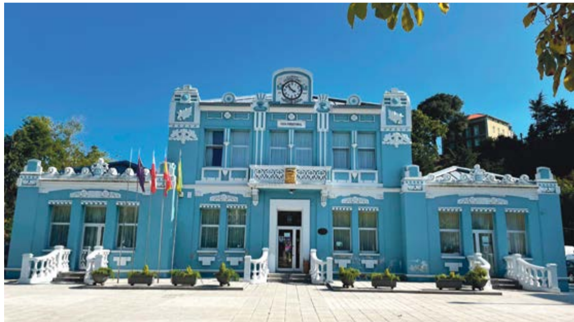
Ayuntamiento de Colindres.

En el ámbito de la atención a las personas, el presupuesto incluye partidas suficientes para la tramitación de ayudas de emergencia, la dotación de fondos para el banco de alimentos y asegura la continuidad de las colaboraciones existentes con otros entes, como la Mancomunidad, Ascasam, Cáritas y Cruz Roja. Para las políticas de conciliación laboral y familiar se destinan partidas para el desarrollo de