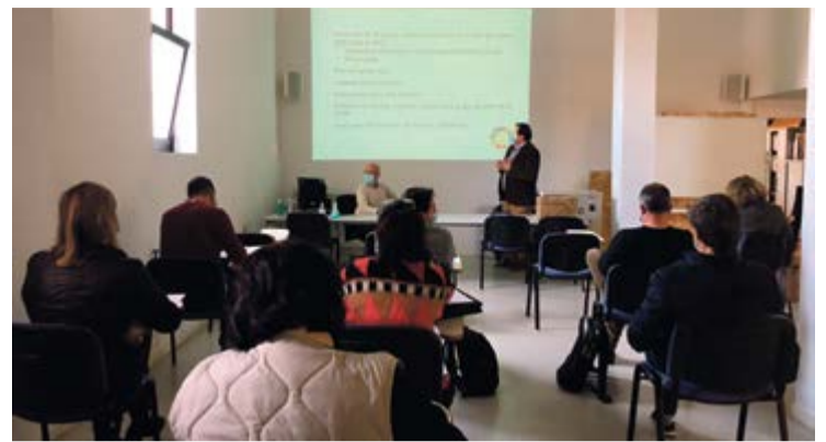
Momento de celebración del Plenario.