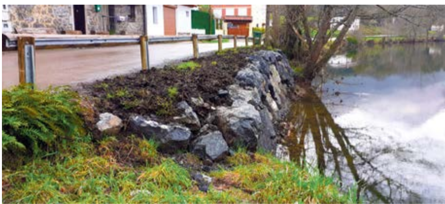
Zona de actuación de las obras, en Ramales de la Victoria.