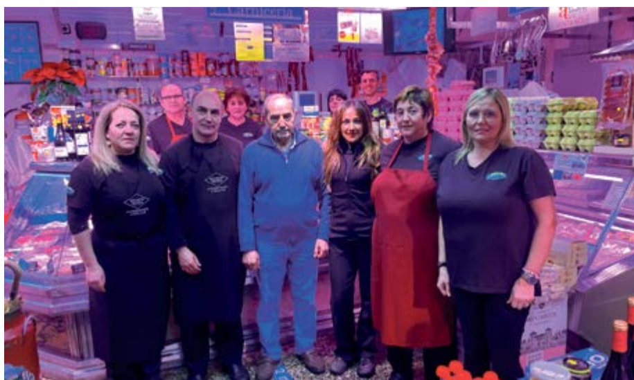
Carnicería Lomillos, serán pregoneros de las fiestas de San José 2022.