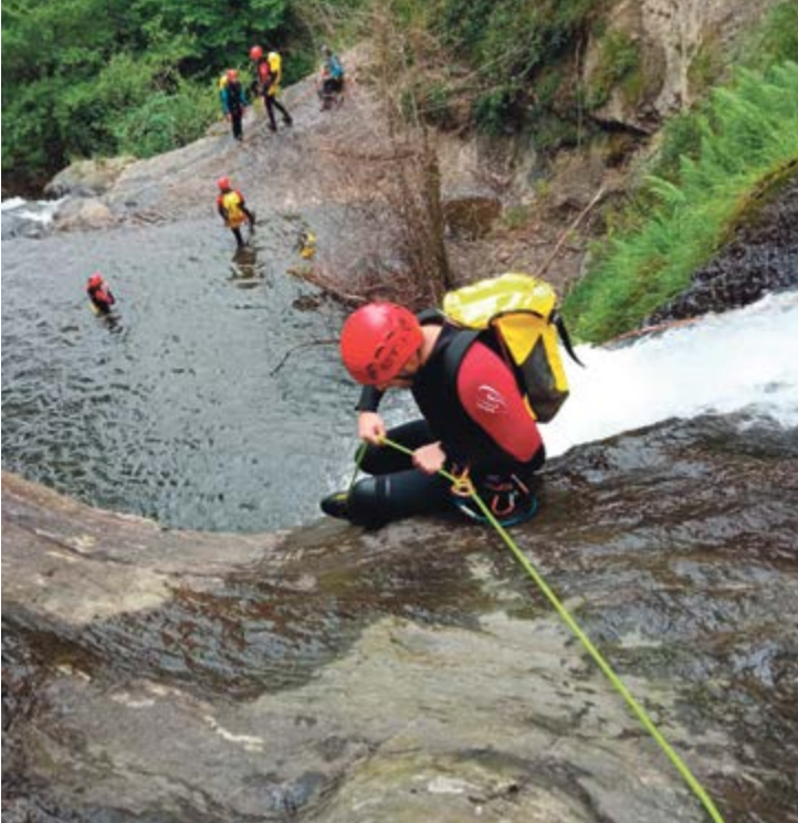
Actividad de barranquismo.

El próximo día 1 de abril la MMS en colaboración con el Ayuntamiento de Ramales de la Victoria, tiene previsto iniciar la