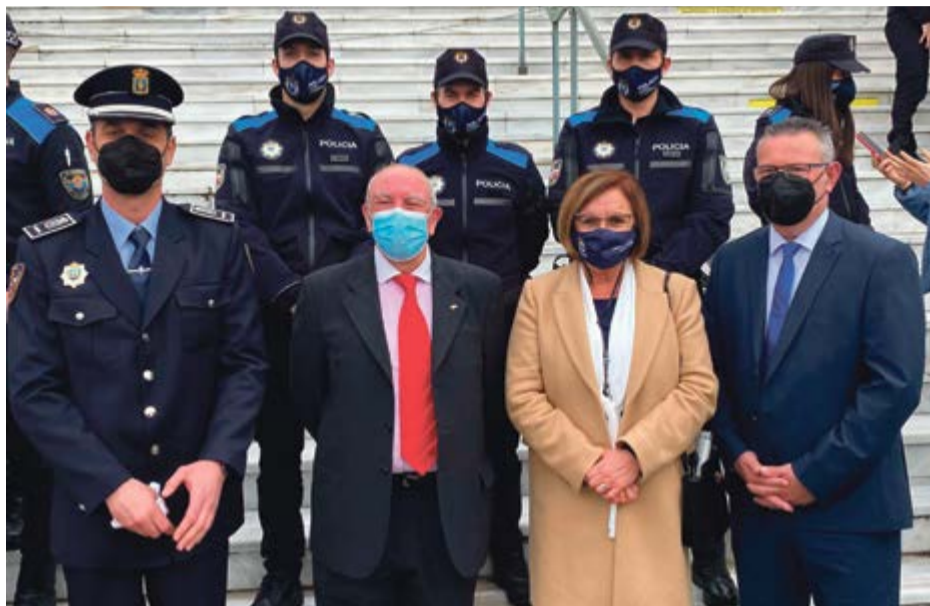
Momento de la ceremonia en el Palacio de Festivales de Santander.