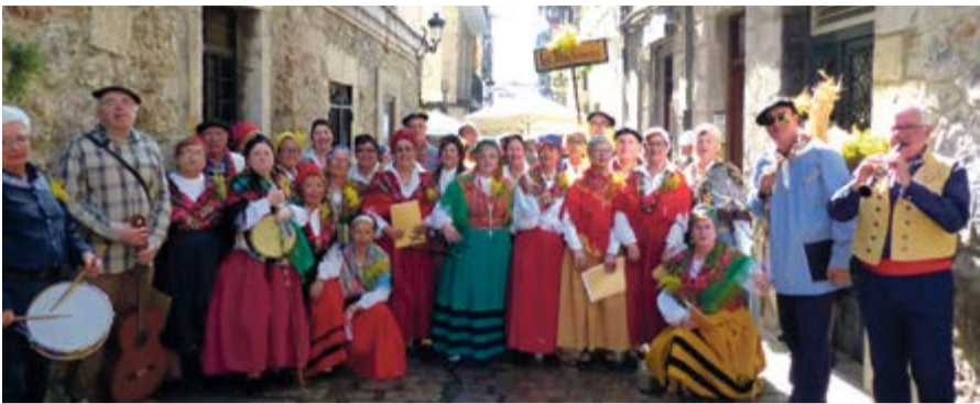
Las Panchoneras de Laredo con el acompañamiento de "Los Piteros de Seña".