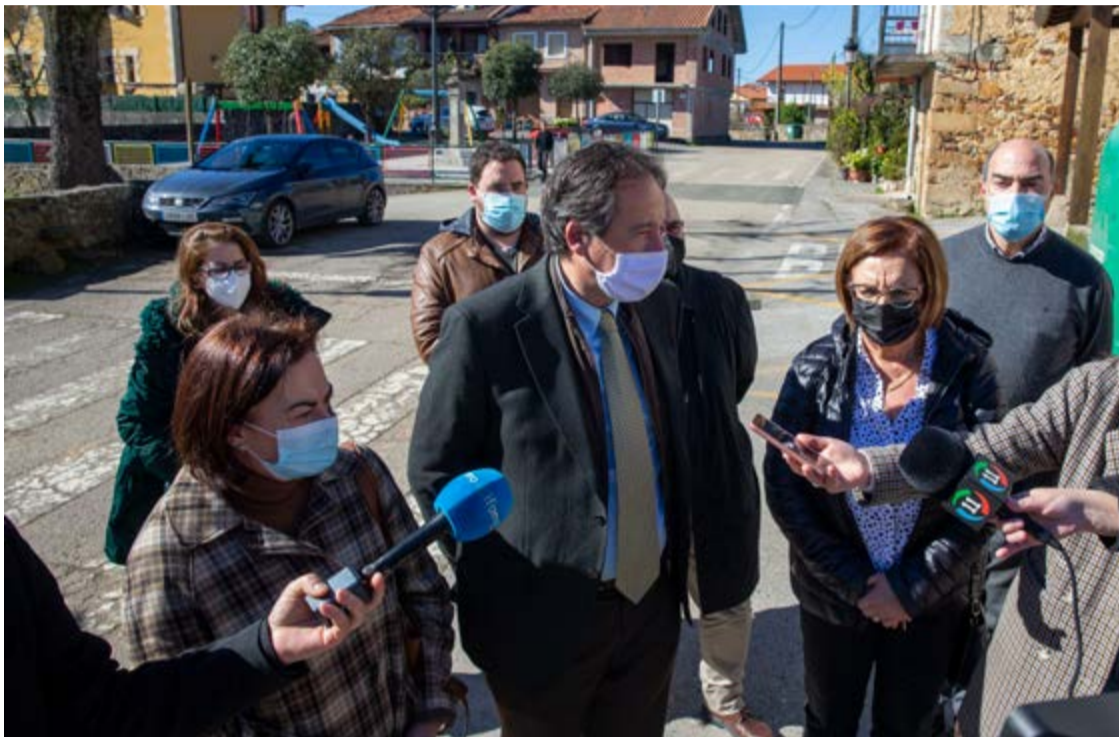
Gochicoa junto a las alcaldesas de los municipios en la presentación del proyecto.