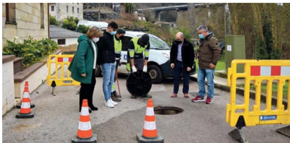
Autoridades locales supervisan la obra.