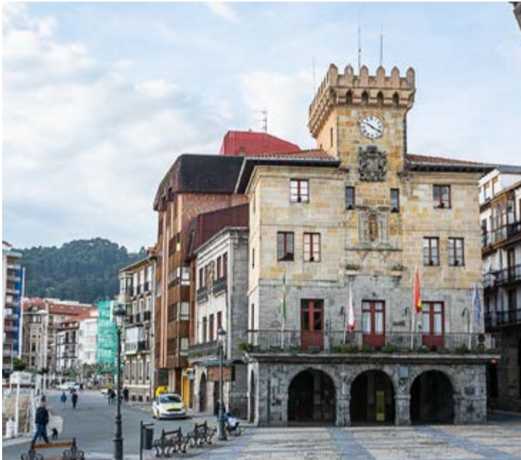
Ayuntamiento de Castro Urdiales.