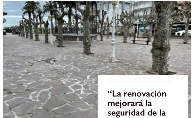
Plaza de la Barrera.