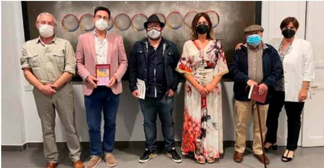
Acto de entrega de los premios de la pasada edición.