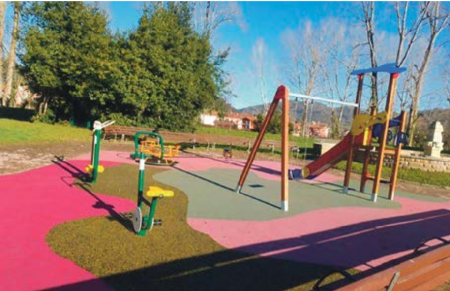
Parque infantil de la Presa en Ampuero.