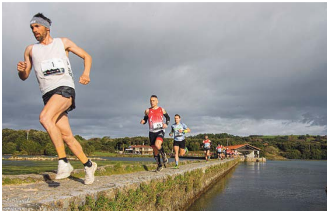
La localidad de Isla (Arnüero) celebrará el domingo, 24 de abril, el Trail Ecoparque de Trasmiera GP Isla.

Quienes en 2021 hayan participado en el Reto Virtual Ecoparque Trail y hubiesen conseguido reserva de plaza para la carrera de 2021, que finalmente fue suspendida, conservarán este derecho y se les remitirá un mail con las instrucciones a seguir para realizar la inscripción con carácter previo a la apertura normal de inscripciones.