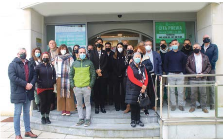
Participantes en la presentación del Plan de Sostenibilidad de Noja.