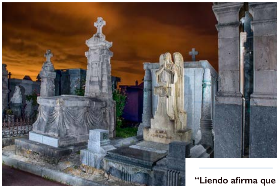
Cementerio de Ballena en Castro Urdiales.

“La mejora de los velatorios es esencial para crear un entorno más amable y aliviar, en la medida de lo posible, el