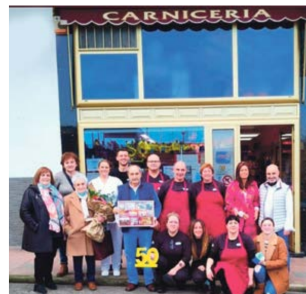
Foto de familia de todo el equipo de Carnicería Lomillos.

Hay muchas gracias que dar por todas las muestras