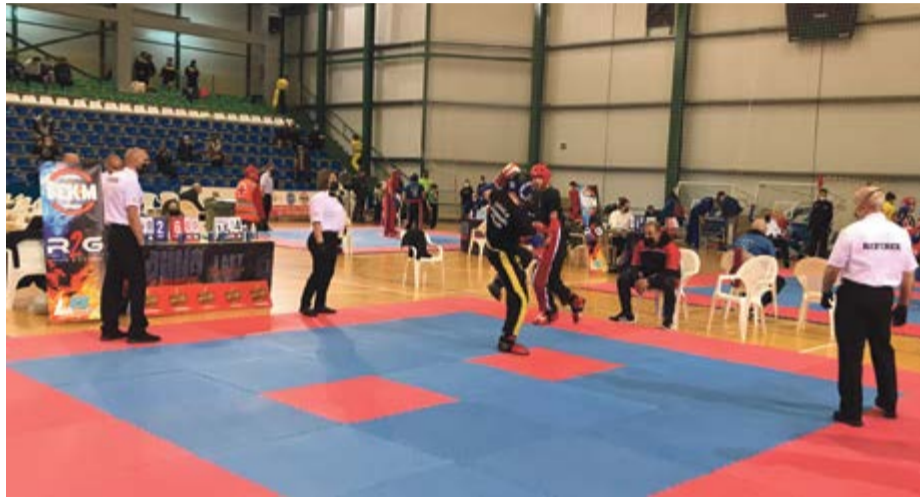
Competidores en uno de los combates de Kick-Boxing.