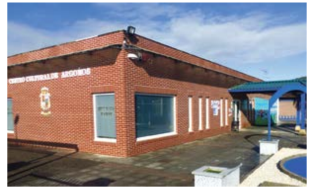
Biblioteca municipal de Argoños.