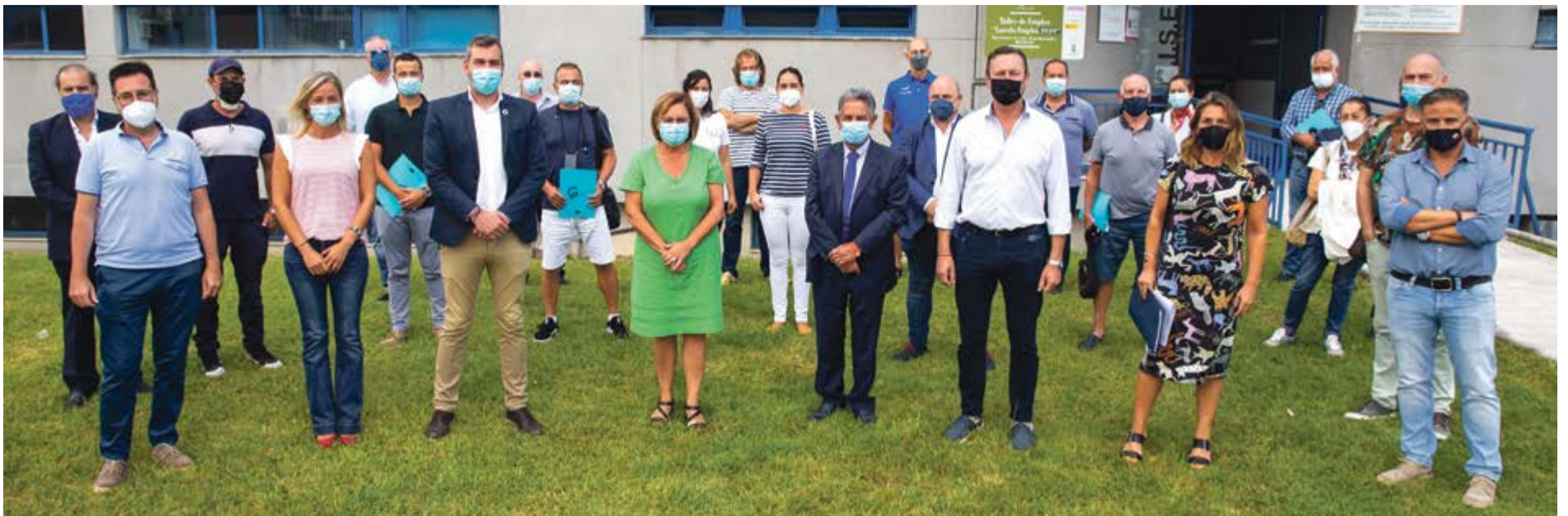
Reunión de autoridades y promotores de los proyectos beneficiarios de las ayudas.