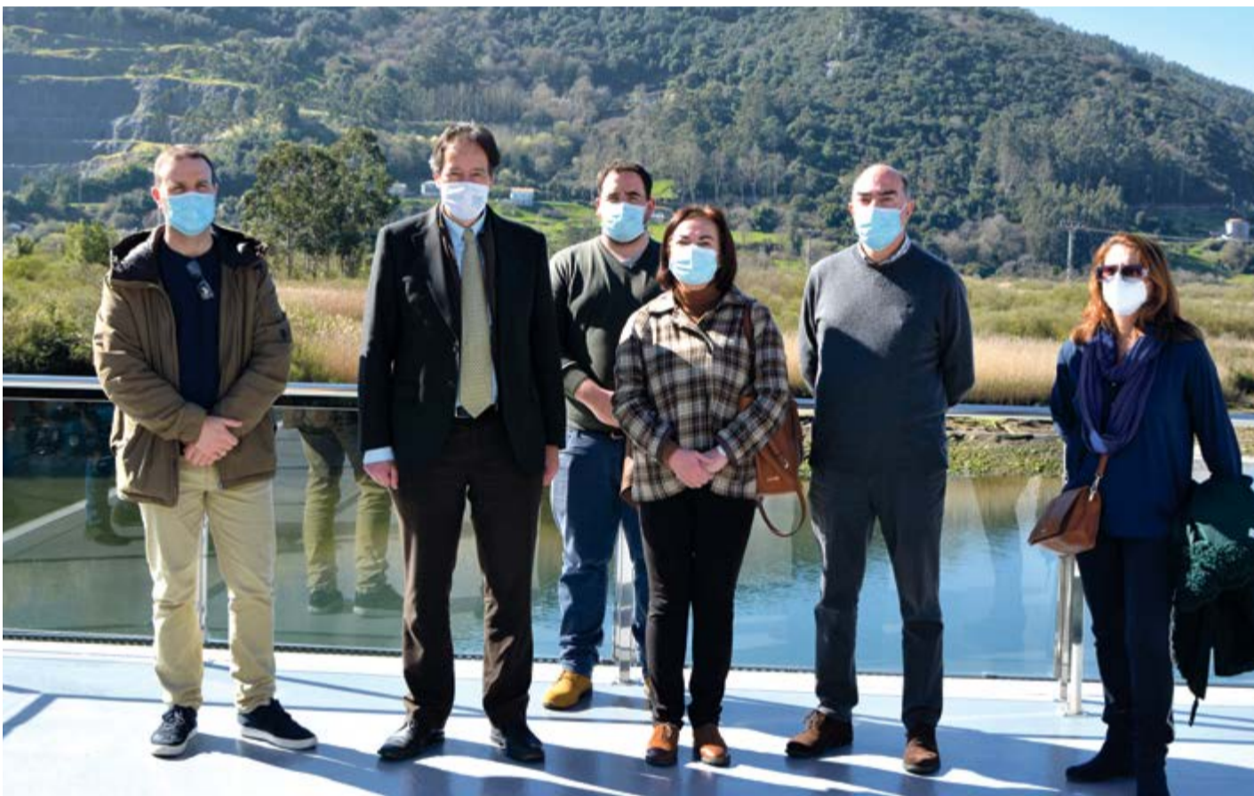
Gochicoa (c.), Iglesias, y miembros del equipo municipal visitaron el Centro Multiusos.