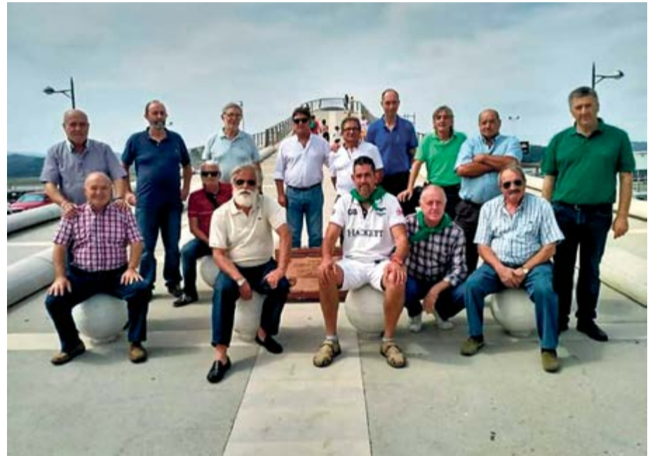
Reunión de la Peña Gastronómica Ogarrío celebrada en Santoña.

La justificación puede ser jugar entre Lunos amigos a la lotería primitiva. El argumento, generar con las aportaciones semanales para el juego, un fondo, que sea suficientemente amplio para que les permita ir cinco o seis veces al año a comer todos los amigos integrantes de la Peña gastronómica Ogarrío a un restaurante distinto, generalmente de la provincia. Pero me dá que el objetivo final es otro.