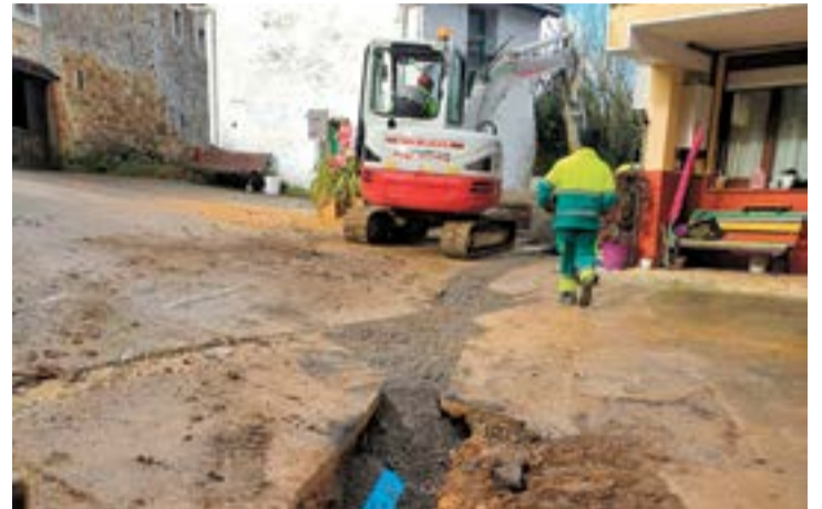
Trabajos en el Barrio La Dehesa.