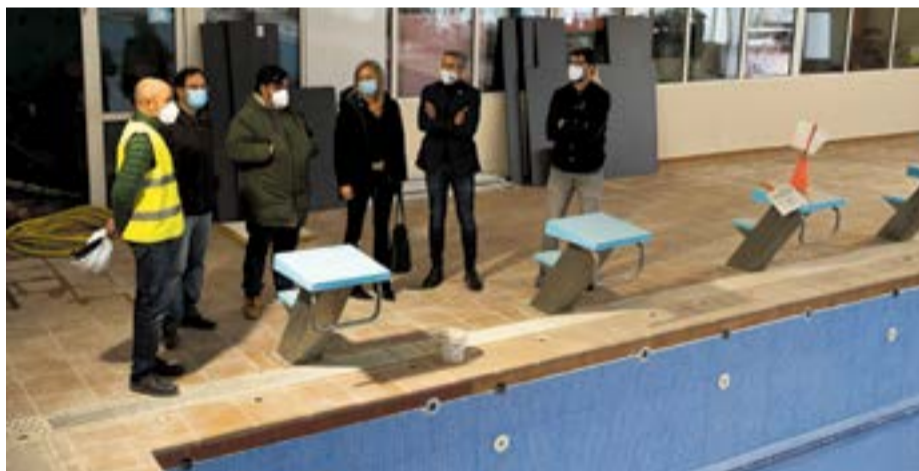
El vicepresidente y la alcaldesa en las obras del polideportivo Peru Zaballa.

Los trabajos incluyen la reparación de goteras, mejora de la accesibilidad, reforma de elementos