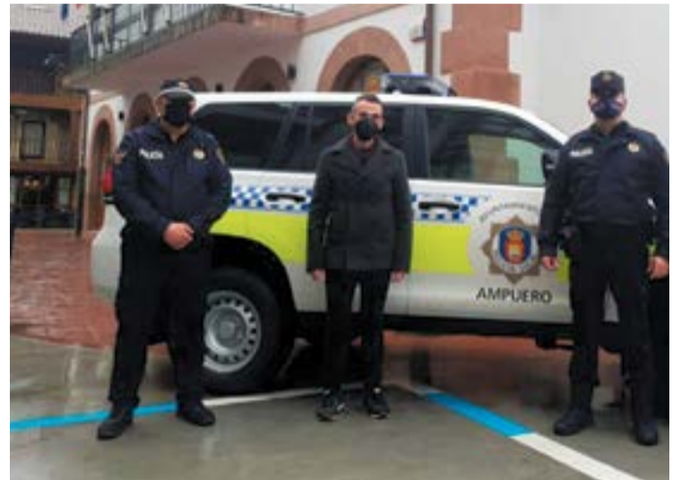
El alcalde y los agentes de la Policía Local con el nuevo vehículo.