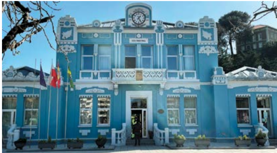
Ayuntamiento de Colindres.

Por otra parte, se pondrá en marcha una ayuda específica para autónomos y empresarios de la hostelería y/o restauración que tengan licencia de terraza y ocupación de vía pública.