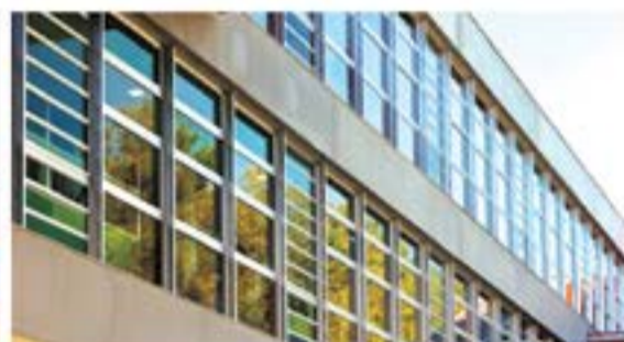
VENTANAS DE ALUMINIO