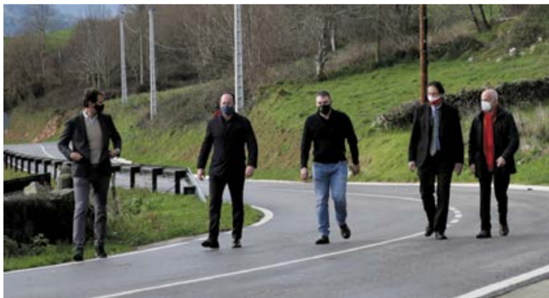
El consejero y las autoridades visitan el tramo reparado.

Gochicoa anunció que su departamento ya está trabajando en el proyecto de mejora del segundo tramo que iría desde Barruelo hasta el propio núcleo de la Alcomba, y