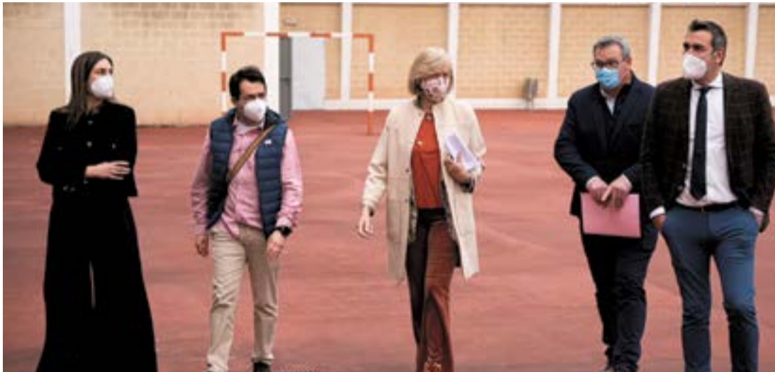
Momento de la visita al IES Marqués de Manzanedo.