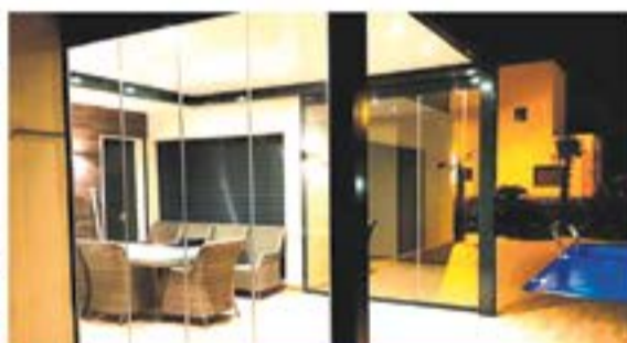
PÉRGOLAS Y TECHOS