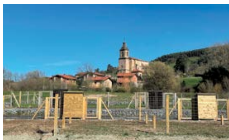
Zona del parque del Tintero donde están los huertos urbanos.

El alcalde, Javier Incera, apuntó que ésta era una demanda de muchos vecinos del