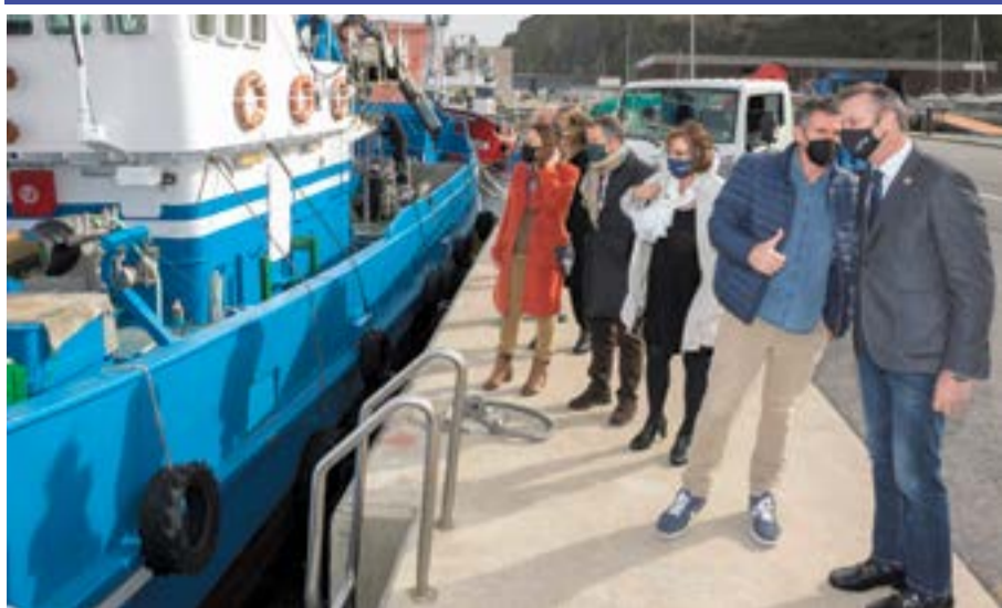
Blanco y autoridades durante su visita al puerto de Laredo.