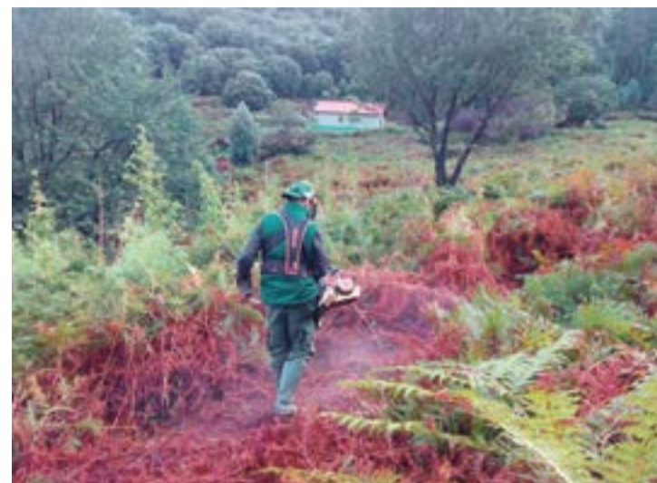
Control de poblaciones de helecho común.

El proyecto promovido por la MMS y la Asociación Cultural Bosques de Cantabria, fue desarrollado con el apoyo del Ministerio para la Transición Ecológica a través de la Fundación Biodiversidad y el Centro de Investigación del Medio ambiente (CIMA), así como la participación del Instituto de Biomedicina y Biotecnología de Cantabria (CSIC-IBBTEC). El mismo, ha tenido como objetivo analizar la viabilidad económica del control de las poblaciones de helecho común ( Pteridium aquilinum ) en un sistema de economía circular de adaptación al cambio climático en la Cordillera Cantábrica, reduciendo los incendios forestales provocados o favorecidos por la presencia de éste, mediante el control de su expansión de manera respetuosa con el medio ambiente. Además, se han obtenido algunos principios activos del residuo vegetal resultante de la eliminación del helecho, estudiando la rentabilidad económica de su comercialización para su uso como insecticida biológico