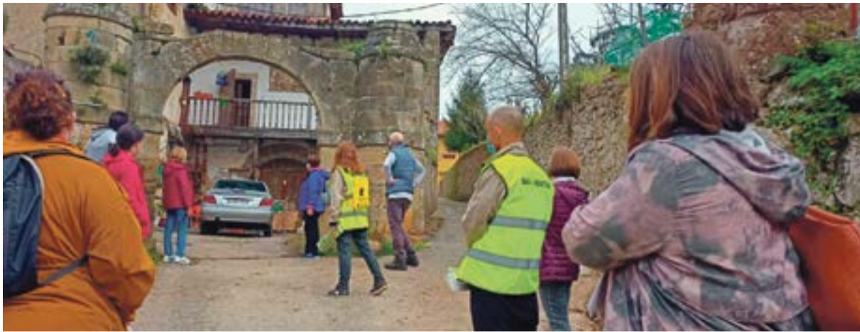
Momento del geopaseo "Las Casonas por Colindres de Arriba".