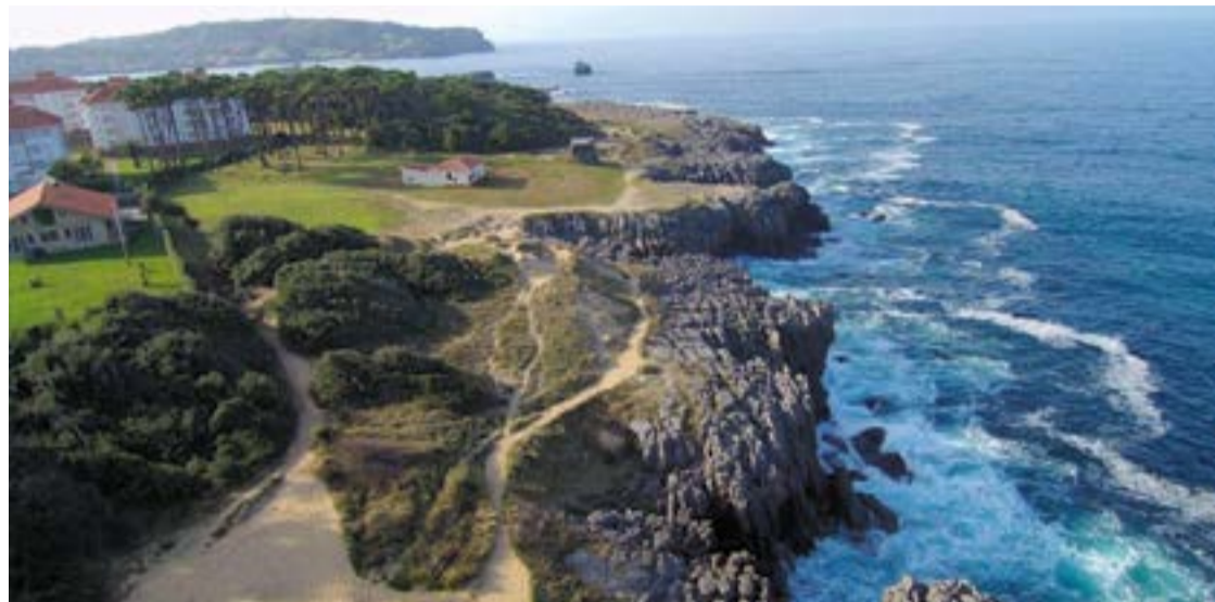
Vista aérea de una ruta costera de la localidad.