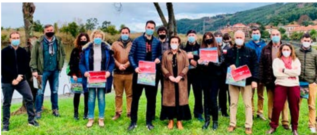
Foto de familia de premiados y autoridades.

La ejecución del proyecto coincide a su vez con el de ‘Revalorización de Espacios Naturales’, para el que también se contrató al mismo número de personas y que comenzó el pasado 1 de octubre de 2020 también con una duración de seis meses. En la actualidad ambos proyectos están siendo ejecutados lo que supone que el ayuntamiento cuenta con 16 personas para desempeñar muchas de las tareas necesarias para un municipio como Limpías contribuyéndose así a que pueda generarse más empleo y ayudar a mitigar los efectos económicos negativos causados por la actual situación sanitaria.