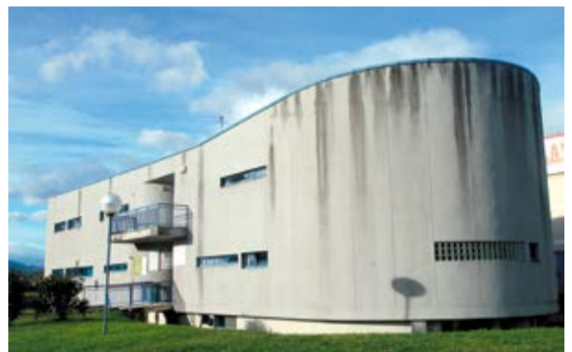
Edificio CISE en Laredo.

“El Centro Integrado de Servicios a las Empresas vuelve a funcionar a pleno rendimiento preservando las precauciones frente al coronavirus”