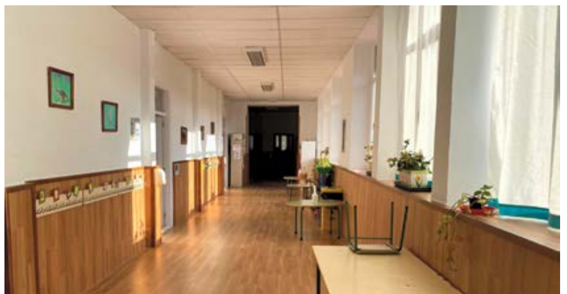
Interior del Colegio ampuerense tras la actuación.

El alcalde de Ampuero, Víctor Gutiérrez, anunció tiempo atrás en la aprobación del presupuesto del año 2020 que en el caso de que las fiestas no se pudieran realizar, ese dinero iría destinado este año en mejorar las instalaciones educativas y deportivas del municipio y