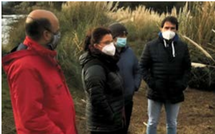
Liendo en la zona afectada por el plumero.

Por otro lado, en materia de saneamiento, se abordó la petición de eliminar los pluviales en el entorno del Polideportivo Municipal Peru Zaballa y el saneamiento del Barrio Hoz de Sámano, una actuación cofinanciada entre el Ayuntamiento de Castro Urdiales y la Consejería de Obras Públicas por un importe de 250.000 euros.