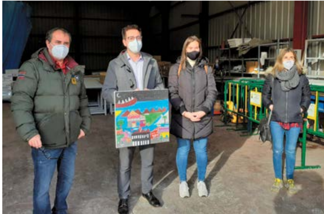
Incera (c.) en la entrega de la donación.