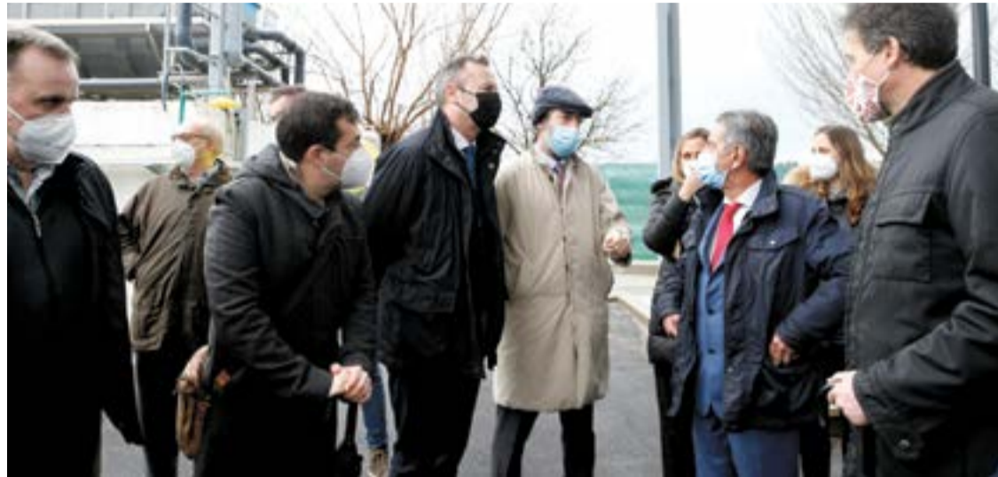
El presidente y los consejeros de Medio Ambiente y Obras Públicas, entre otros.

Concretamente, la actuación desarrollada permite ampliar la capacidad de tratamiento de las aguas residuales generadas por el sector conservero local, favorecer su actividad y dar solución a las inundaciones que se producían en la zona, especialmente en época de lluvias abundantes y mareas altas, como consecuencia de los