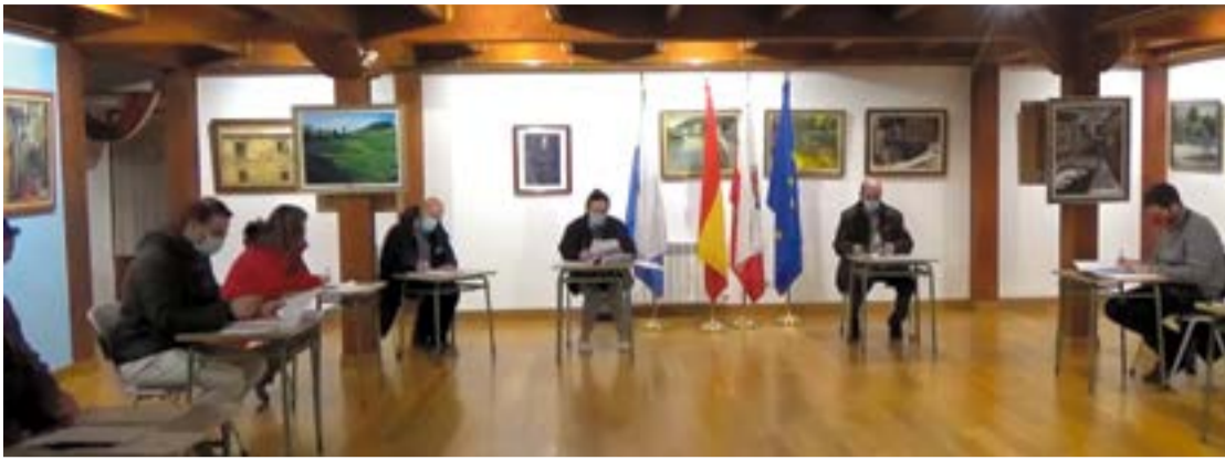
Pleno del Ayuntamiento en la Casa de Cultura.