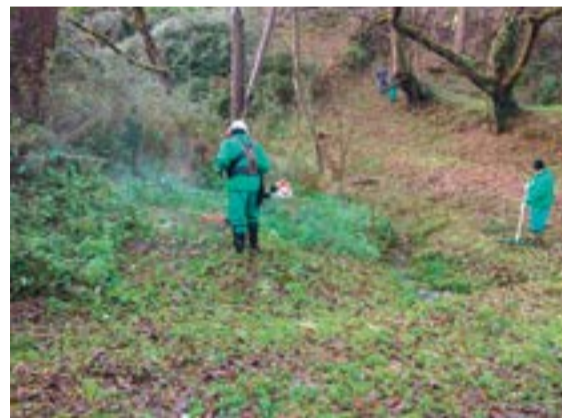
Actuaciones ejecutadas en Voto.

Durante los meses de enero y febrero se ha continuado con la realización de diversas actuaciones de limpieza, desbroce o eliminación de vegetación exótica invasora en los municipios de la Mancomunidad.