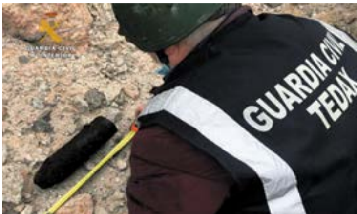
Artefacto hallado en Limpias.