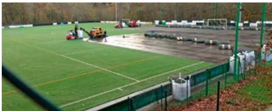
Trabajos de cambio de césped.