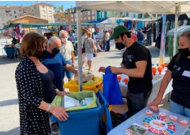
Actividad de sensibilización en el Mercado de Colindres.

Durante el mes de septiembre el personal técnico de la MMS ha desarrollado diversas actividades de sensibilización tanto en el marco de la Campaña de Comunicación de Ecoembes “El Mundo”, como del proyecto LIBERA, “unidos contra la basuraleza”. En relación a las Actividades de sensibilización y Street Marketing, el pasado día 24 de septiembre se instaló en el Mercado de Colindres un stand informativo en colaboración con el