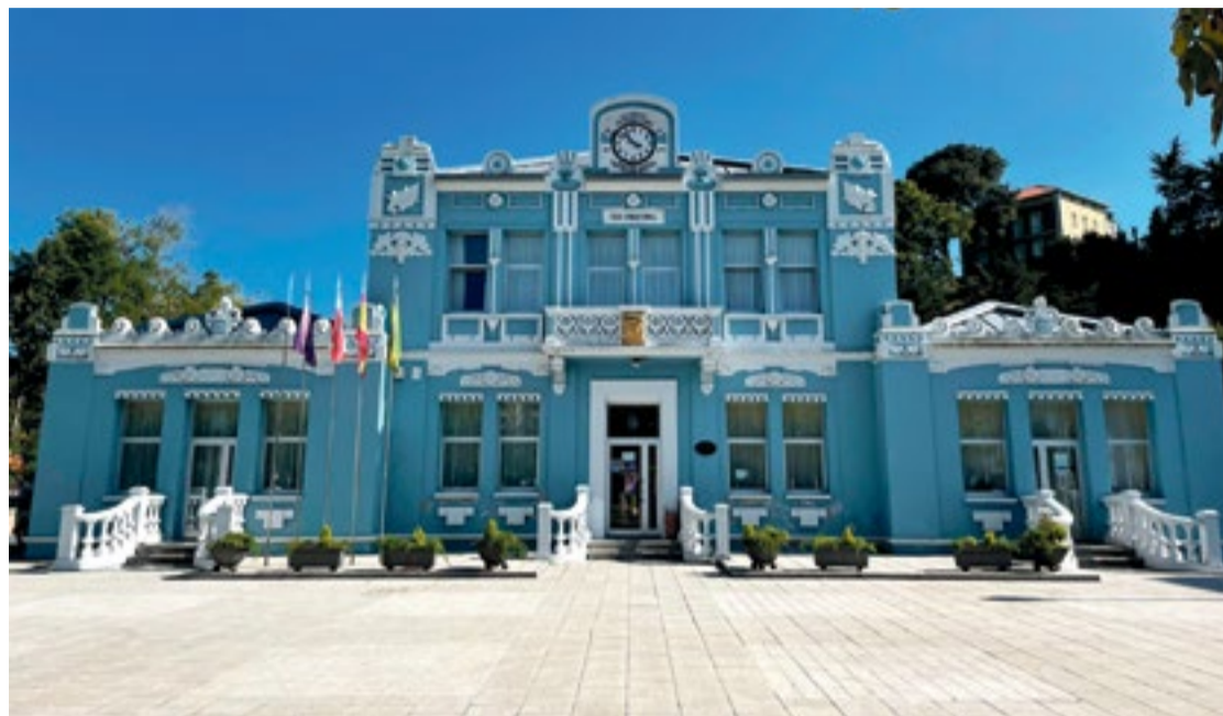
Ayuntamiento de Colindres.

“Si la campaña funciona bien, como ya ha sucedido anteriormente, estos 130.000 euros se transformarán en un movimiento de activación económica que rondará los 400.000 euros; sin duda, una