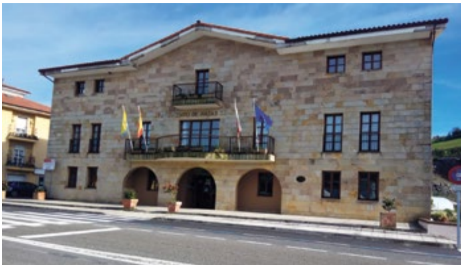
Ayuntamiento de Hazas de Cesto.