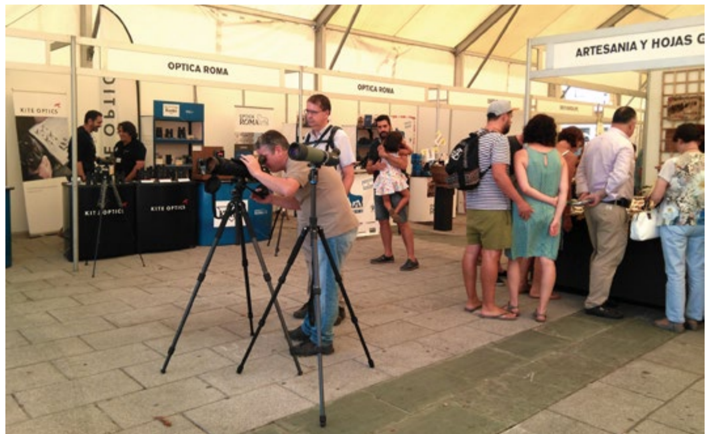
Público de Econoja, probando equipos de óptica.