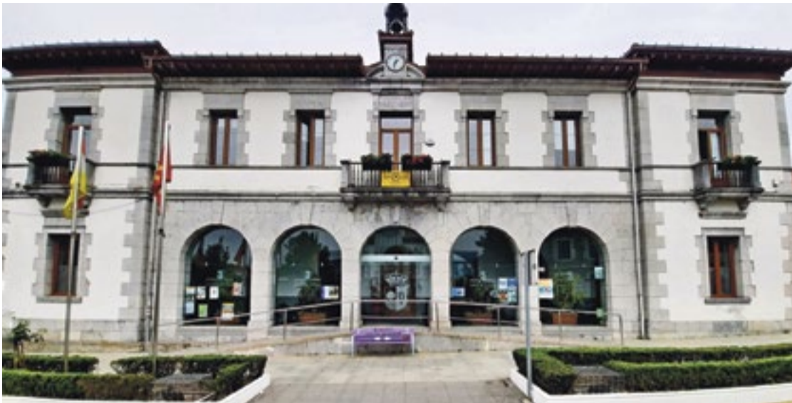
Ayuntamiento de Rames de la Victoria.