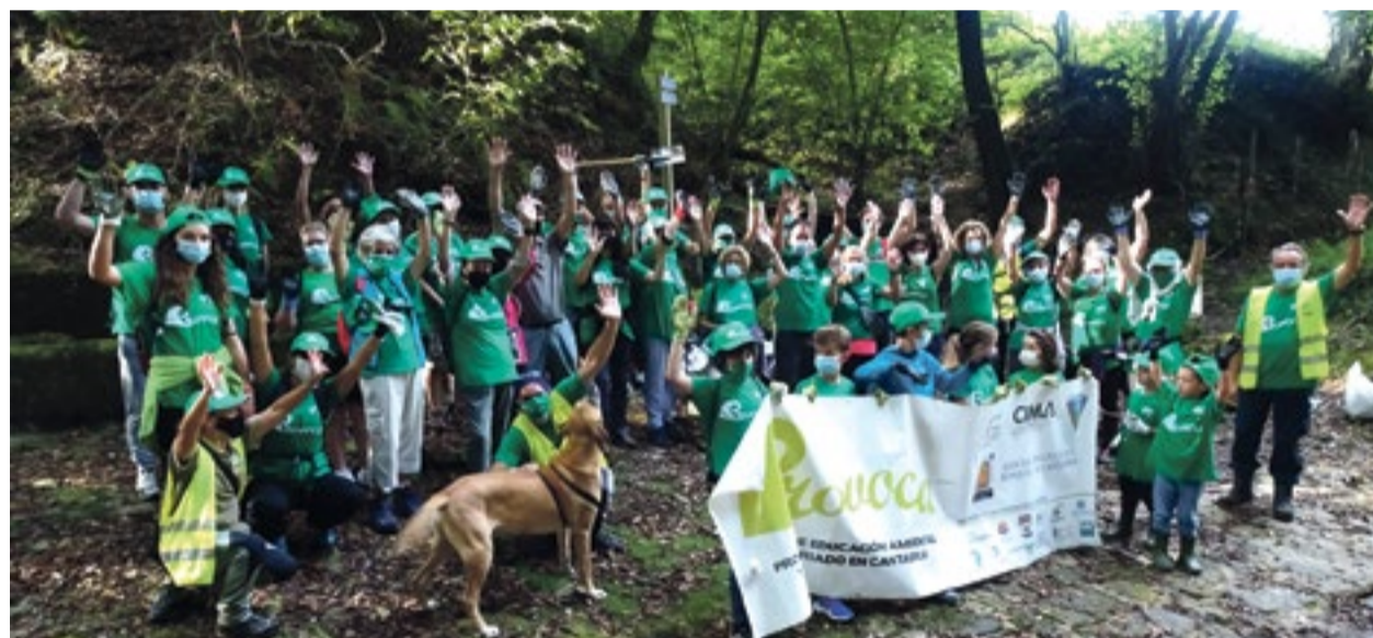
Reunión de voluntarios en la finca municipal "El Rancho".

El medio centenar de voluntarios que se reunieron en la finca municipal "El Rancho" con el objetivo de contribuir a la regeneración del bosque que antaño ocupó esa zona, disfrutaron de un espléndido día de campo para desarrollar esta actividad organizada por Bosques de Cantabria, dentro del programa PROVOCA del Gobierno de Cantabria, contando