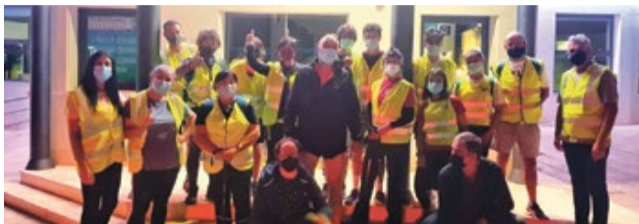
Participantes e integrantes de la corporación municipal.