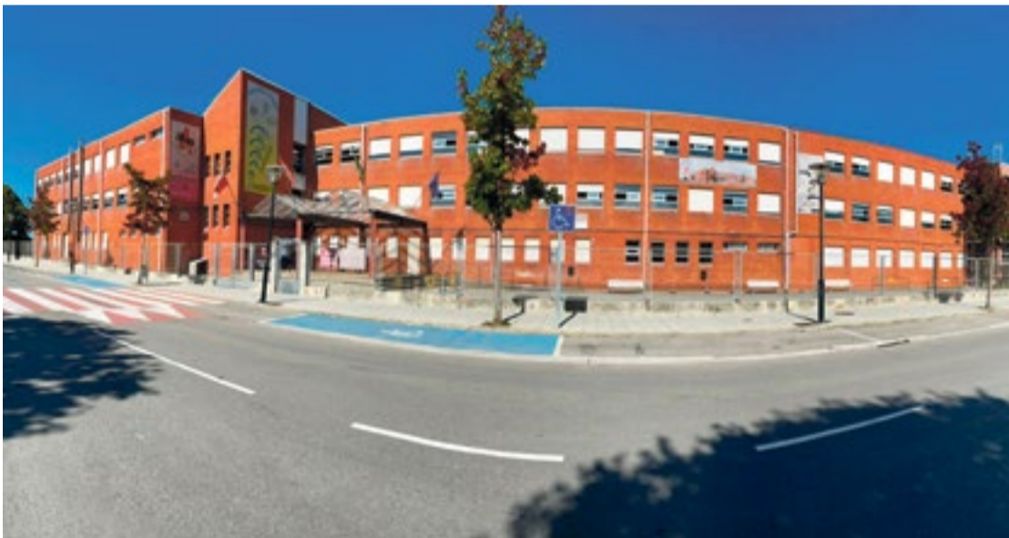
Instituto Valentín Turienzo.