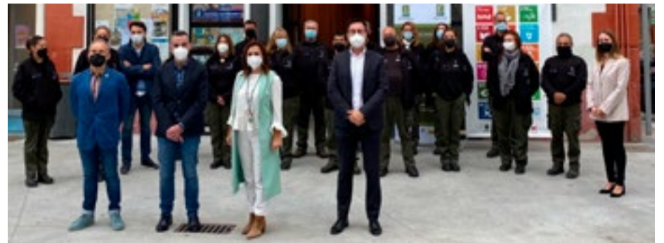
Momento final del acto de clausura.

El objetivo de esta iniciativa es concienciar y movilizar a la ciudadanía para mantener los espacios naturales libres de basura y que podamos, de esta manera, liberar mucha más vida a favor de la biodiversidad. Inicialmente se realizaron acciones de sensibilización ambiental, y a continuación una ruta interpretativa en la que se interpretó diverso patrimonio natural incluido en la candidatura “Valles de Cantabria” aspirante a Geoparque Mundial de la UNESCO. Para finalizar, se realizó una recogida de “basuraleza” en los entornos de las playas del Regatón (Laredo) y Ris (Noja).