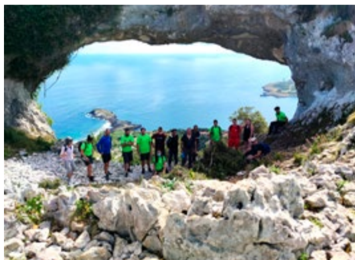
Geo-Ruta en Monte Candina (Liendo).

A continuación, se muestra el listado de actividades disponibles que se realizarán en horario de mañana siendo imprescindible la inscripción previa: