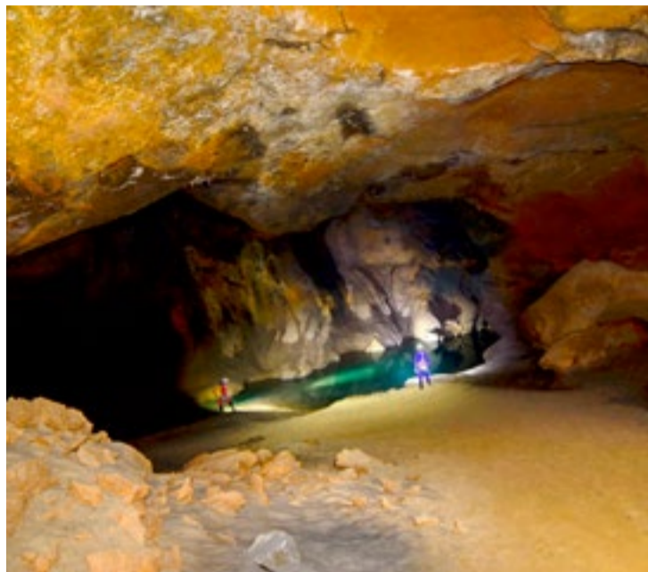
Actividad de espeleología.

El pasado día 20 de septiembre desde la Mancomunidad de Municipios Sostenibles de Cantabria (MMS) se ha tramitado ante la Comisión Nacional Española de Cooperación con la UNESCO la documentación correspondiente con objeto de la presentación del dossier final de la candidatura “Valles de Cantabria” aspirante a Geoparque Mundial UNESCO. Posteriormente, el día 30 de noviembre dicha Comisión enviará a la UNESCO las candidaturas finalistas seleccionadas para presentar al Consejo de Geoparques Mundiales.