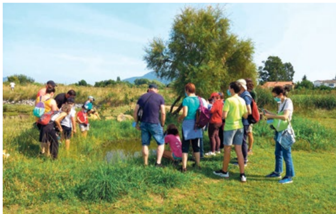
Participantes en la ruta interpretativa.

Los asistentes, sobre todos los más pequeños, aprendieron a diferenciar tres tipos de gaviotas y otras aves asociadas al medio acuático como zarapitos y garzas reales, además de otras que frecuentan ambientes próximos a la marisma como cornejas, estorninos, buitrones, lavanderas y gorriones molineros. Durante el trayecto también se dejaron ver algunos lagartos verdes