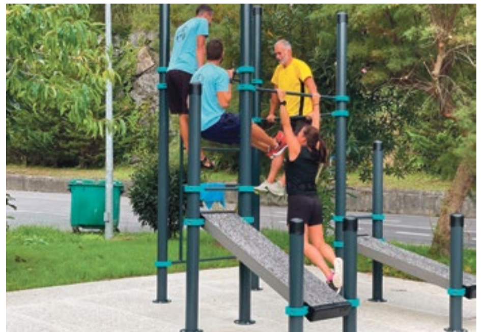
Usuarios ejercitándose en las nuevas instalaciones.

Si bien se trata de un número limitado de piezas, este bonito museo bien merece la visita de los amantes de la Armada.