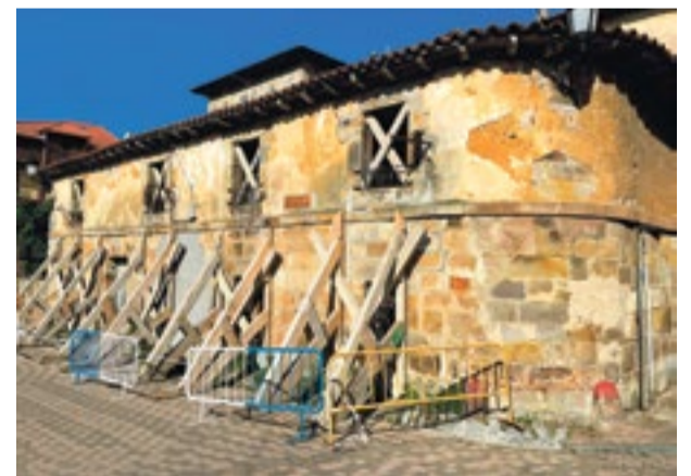
Lonja Fluvial del Puerto de Limpias.

La propuesta ganadora del concurso público convocado por la Consejería de Desarrollo Rural, Ganadería, Pesca, Alimentación y Medio Ambiente del Gobierno de Cantabria, para la restauración y rehabilitación de la Lonja Fluvial del Puerto de Limpias como Centro de Educación Ambiental y Social (CEAS), ha sido la presentada por los estudios españoles AGi architects y CSD3 arquitectos. En su proyecto han convencido cuatro principios: La puesta en valor de la lonja fluvial, a través de la conservación y restauración del edificio para devolverlo a su estado original, restaurando estructuras existentes en piedra y madera. El incremento de los espacios cerrados incorporando el patio rehabilitado, con cubierta ligera e iluminación