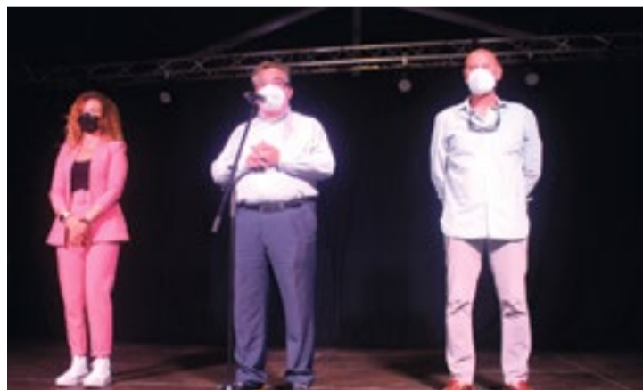
Acto de inauguración de la IV Bienal de acuarela Villa de Noja.