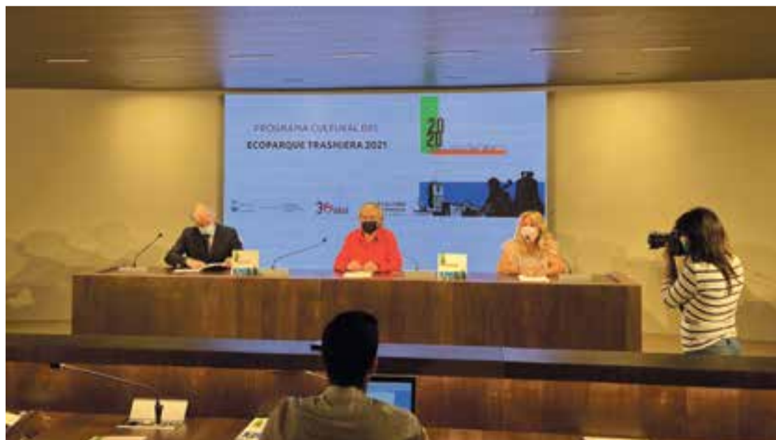
Presentación de la programación cultural 2021 del Ecoparque de Trasmiera.