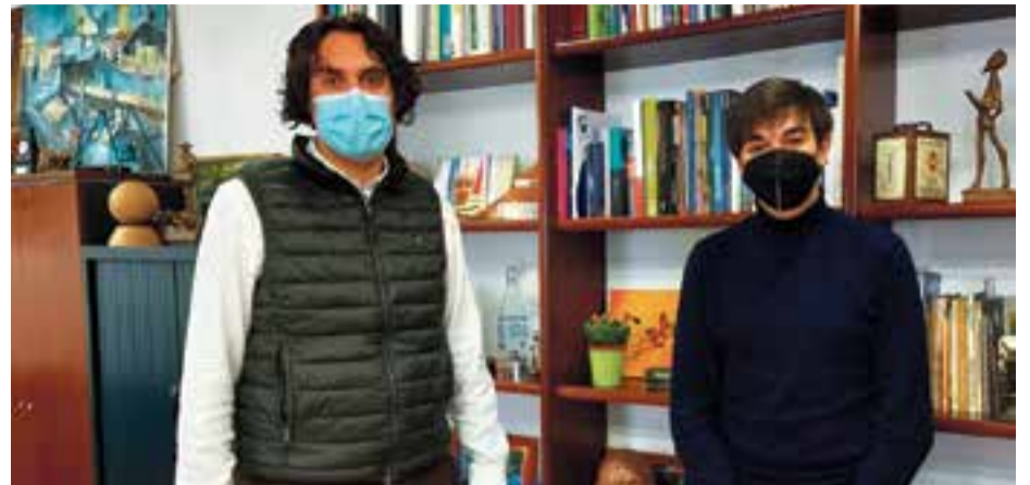
El alcalde felicita a Colsa.