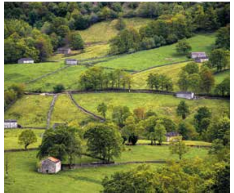
Estampa de valles pasiegos.

El informe señala que el documento no es adecuado, ya que debiera ser único para los parques eólicos Ribota, Garma Blanca, Amaranta y Quebraduras, y que la evaluación del impacto ambiental debería haberse realizado de manera conjunta, como ya concluyó el Gobierno regional respecto al parque eólico Garma Blanca.