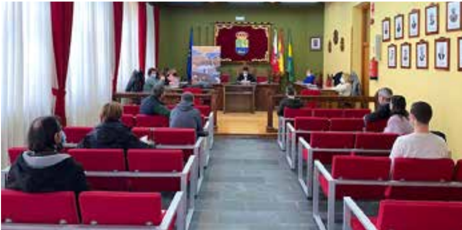
Reunión de la Comisión Geoparque celebrada en Colindres el pasado mes de marzo.

La Mancomunidad de Municipios Sostenibles (MMS), con el apoyo del Gobierno de Cantabria y la Universidad de Cantabria (UC), han defendido el pasado día 23 de junio la candidatura Valles de Cantabria ante el Comité Nacional Español de Geoparques.