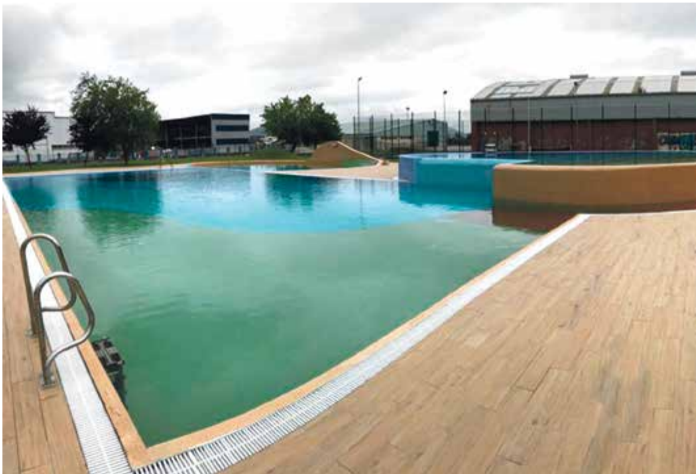
Panorámica de la piscina al aire libre en Colindres.