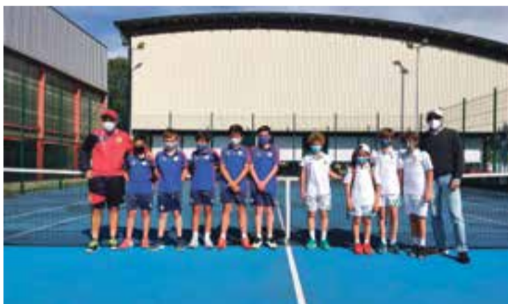
El equipo alevín del CDE tenisco de Colindres disputará el Campeonato de España en Murcia el 23 de Agosto tras proclamarse campeón regional al vencer el pasado 5 Junio, al RST La Magdalena por 3-1. Es el primer título regional que consigue el club.

Javier Incera afirmó que “se trata de una inversión importante, una apuesta decidida para mejorar uno de los barrios emblemáticos de nuestro municipio. Colindres es un pueblo vivo y nuestras calles y plazas tienen que ser puntos de encuentro cómodos, acogedores que nos permitan socializar, que hagan nuestra vida más cómoda. El objetivo último siempre es mejorar la calidad de vida”.