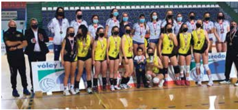
El equipo cadete femenino junto a autoridades.