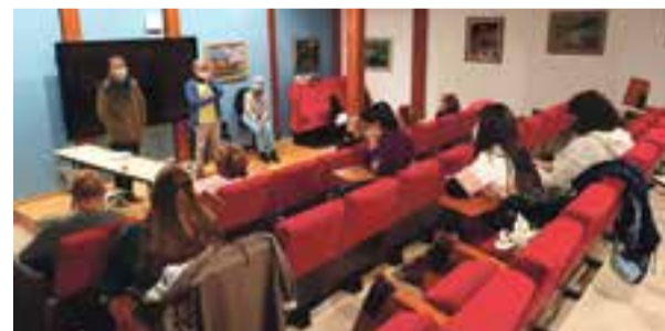
Reunión de trabajo de 'La Cívica Teatro'.