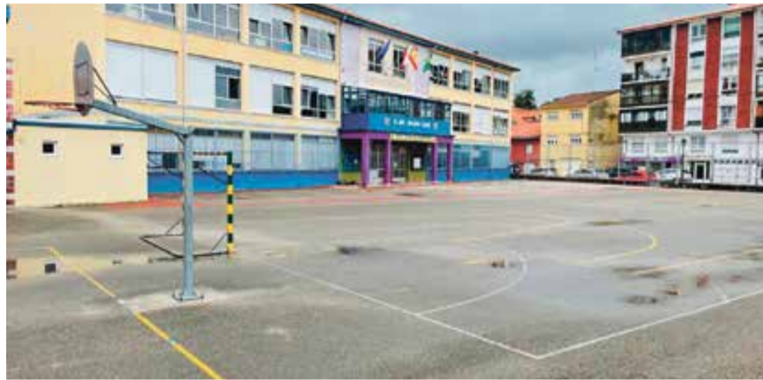
Colegio Fray Pablo, en pleno Campo de las Ferias.

Según Incera, “la parte más destacada del proyecto es la que tiene que ver con la renovación del patio escolar, que se ha diseñado teniendo en cuenta las sugerencias del centro educativo”. Además, el