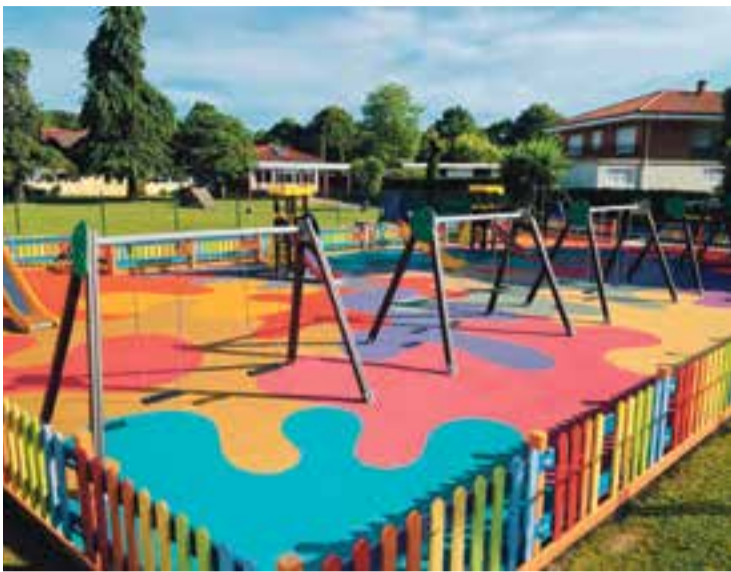
Parque infantil de la Plaza José Hierro.