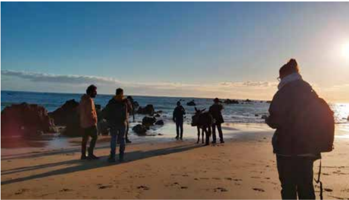
Un momento de la grabación del documental.