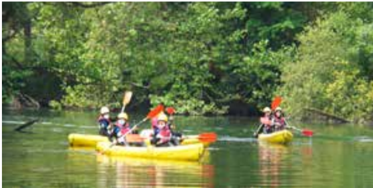
Eco-experiencia descenso del Asón.

Desde el Servicio de información y Promoción Turística se han desarrollado durante el segundo trimestre del año (abril-junio) un total de 27 actividades (geo-rutas/geo-paseos y eco-experiencias), que han contado con la participación de 205 personas.