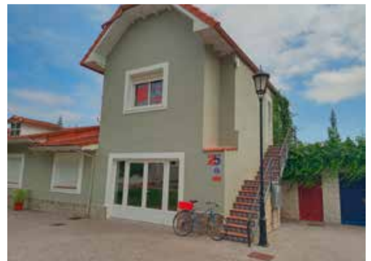
Sede de Protección Civil de Colindres.