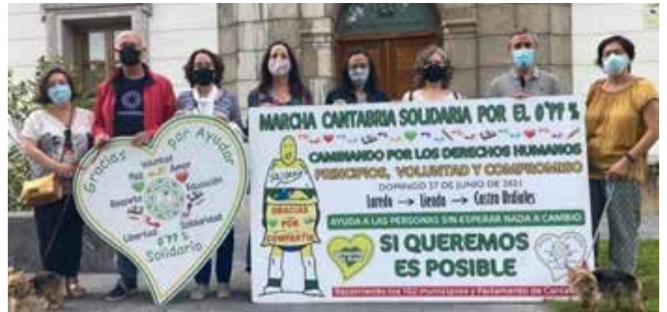
Vecinos de Laredo en apoyo de la Marcha solidaria.