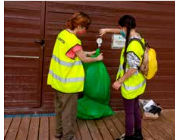
Momento del pesaje de la "basuraleza" recogida.

El pasado 12 de junio en colaboración con el Ayuntamiento de Noja a