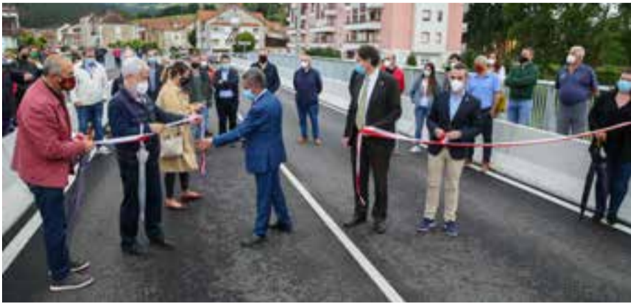
El presidente corta la cinta inaugural junto a Gochicoa y Gutiérrez.