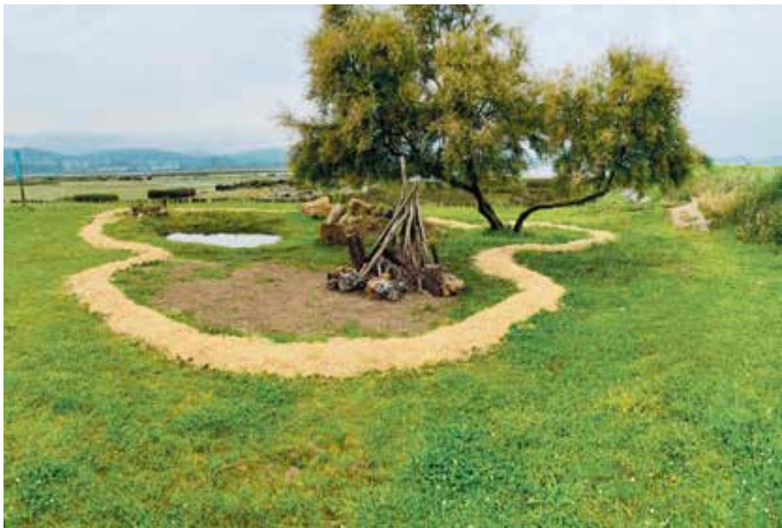
Zonas de actuación en el Paseo Marítimo.