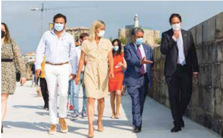
El presidente, junto al resto de autoridades, en su recorrido por el dique.