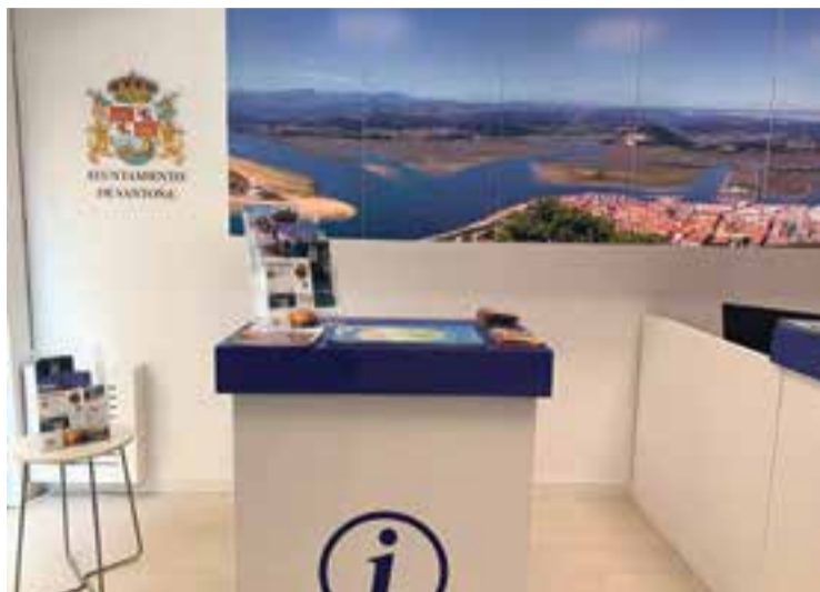
Nueva imagen de la Oficina de Turismo de Santoña.

Con fondos de una subvención recibida del GAC Oriental de Cantabria se ha dotado a la oficina de turismo de una nueva 'identidad marinera' a través de la rehabilitación de sus instalaciones y su renovación estética con paneles decorativos, luminarias, suelo y mobiliario. Con esta reestructuración del espacio, la oficina de turismo se ha convertido también en un espacio expositivo, con lo que se gana efectividad al ser el punto de partida del turista y visitante para conocer todo lo que el municipio y la zona le puede ofrecer en un solo vistazo.