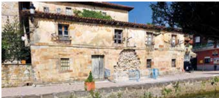
Fachada desplomada en la antigua lonja.