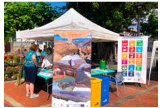
Stand de la MMS en el Mercado Natural de Escalante.