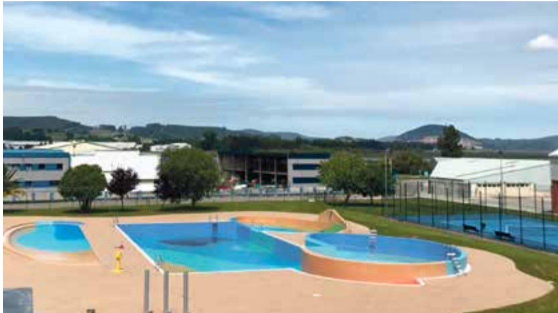
Panorámica de la piscina al aire libre en Colindres.

El Ayuntamiento de Colindres comenzó la temporada estival con la apertura de las piscinas municipales descubiertas, que permanecerán a disposición de los usuarios hasta el próximo 5 de septiembre.