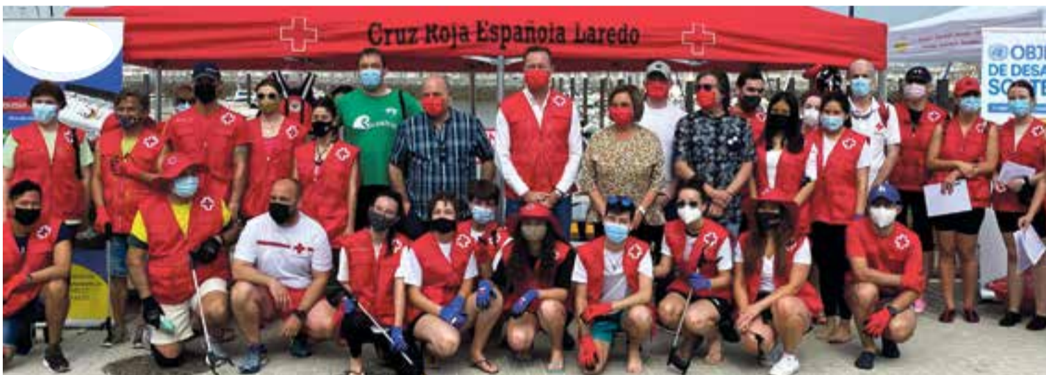
El consejero con los voluntarios del programa LIBERA en Laredo.