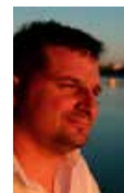
José Luis Escrivá.