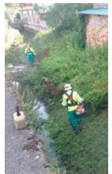
Actuaciones realizadas en Laredo y Limpias.

CORRES CON UNAS ZAPATILLAS HECHAS CON LA BOTELLA DE LA QUE BEBES MIENTRAS RECICLA MÁS. MEJOR. SIEMPRE.