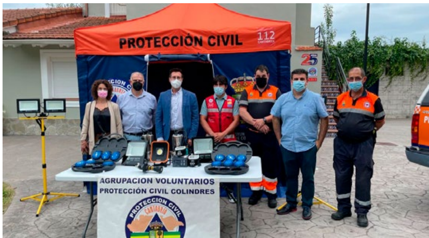
Autoridades y voluntarios de Protección Civil.