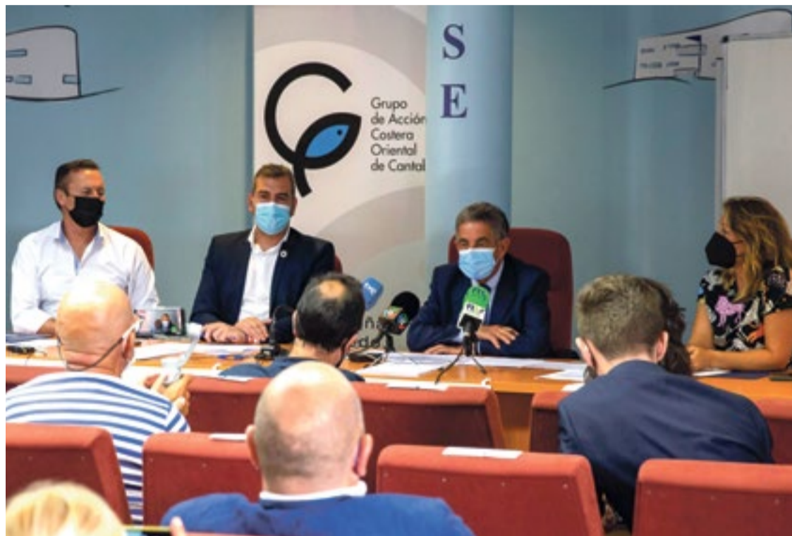
Blanco (i.), Abascal y Revilla, en la presentación y firma de los contratos.

Tanto Revilla como Blanco han felicitado a los promotores, tanto públicos como privados, de los proyectos beneficiarios, que van desde iniciativas vinculadas al surf, la movilidad sostenible, el remo o el ecoturismo hasta la mejora del funcionamiento de las cofradías de pescadores o actuaciones de