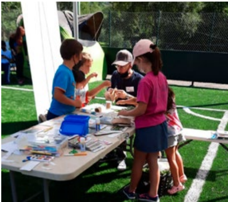
Momento de realización de los talleres educativos.