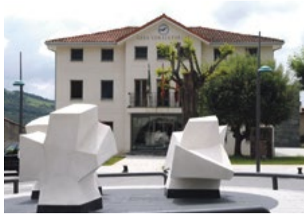
Ayuntamiento de Noja.

El Ayuntamiento de Noja ha solicitado una subvención de cerca de 250.000 euros procedente de la Consejería de Obras Públicas del Gobierno de Cantabria para la renovación y mejora de diferentes instalaciones eléctricas y energéticas en el Consistorio y en el Centro de Ocio Playa Dorada para lograr una mayor seguridad y un mejor rendimiento en estos edificios municipales, así como una mayor eficiencia energética. Estas iniciativas se enmarcan dentro de la estrategia del Ayuntamiento para alcanzar los Objetivos de Desarrollo Sostenible en el municipio. En concreto, en el Consistorio se va a llevar a cabo una modificación en el sistema de climatización con el objetivo de “implementar las últimas recomendaciones para combatir la expansión de la pandemia o de cualquier otro virus”, como recoge el informe técnico. Como ha explicado el alcalde, Miguel Ángel Ruiz