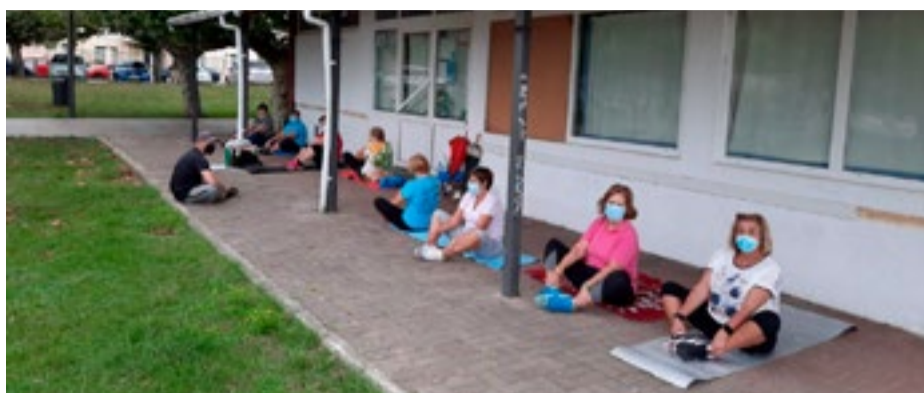
Momento de realización de la actividad en Laredo.