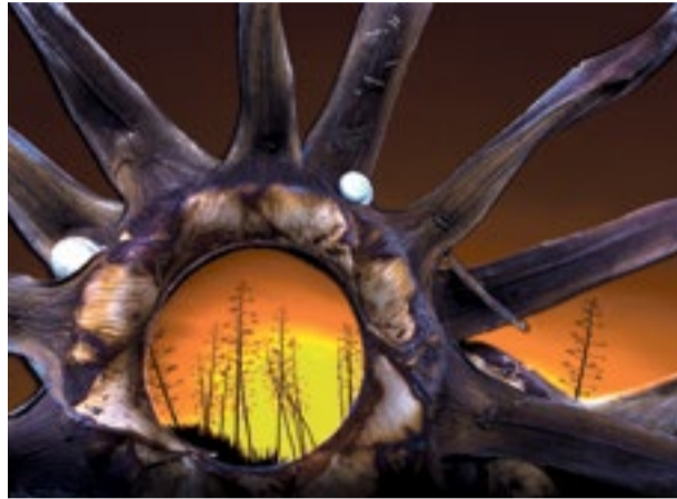
Un sol de medianoche