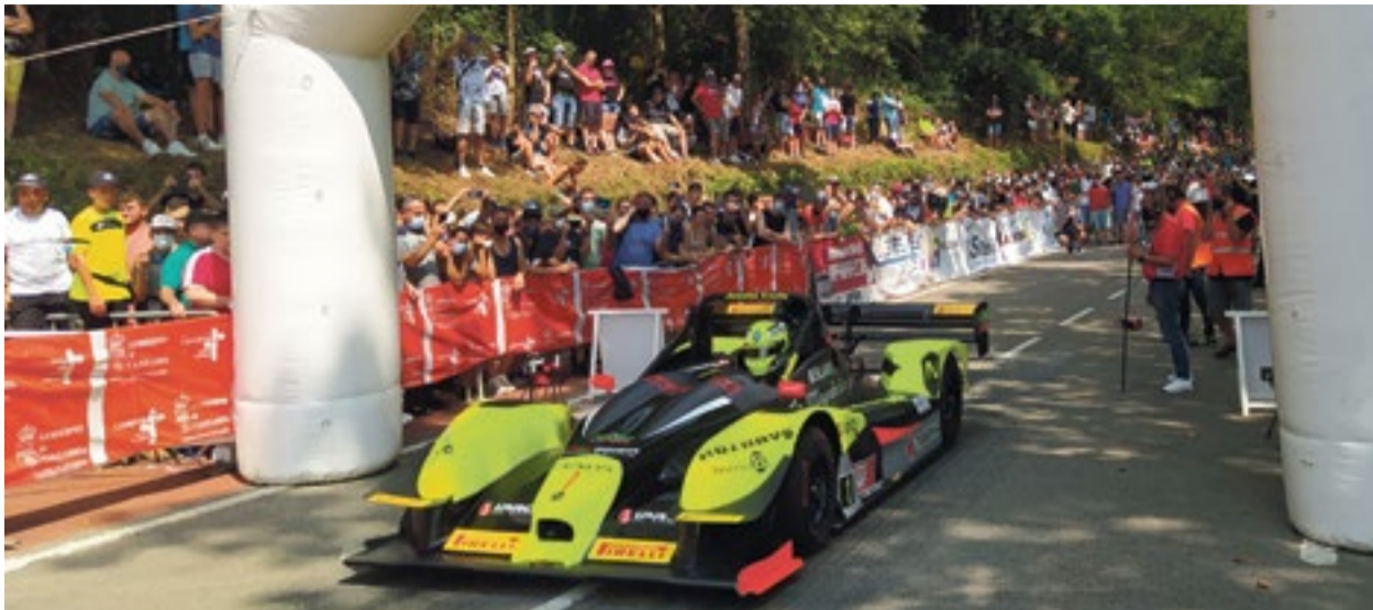
Joseba Iraola, vencedor en lo más alto del podio.