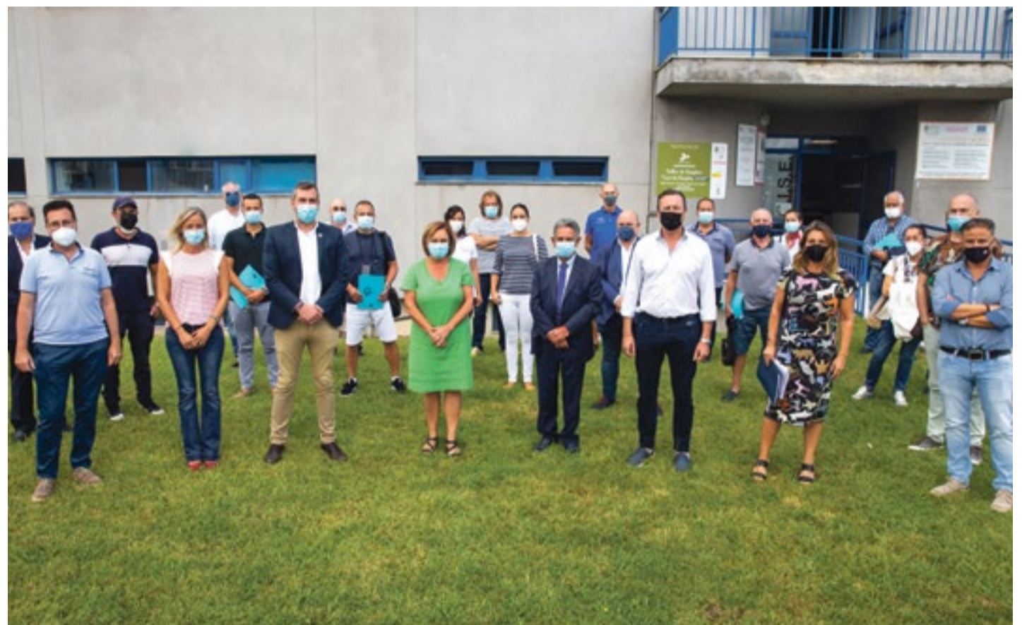
Autoridades con los promotores de los proyectos beneficiarios de las ayudas.