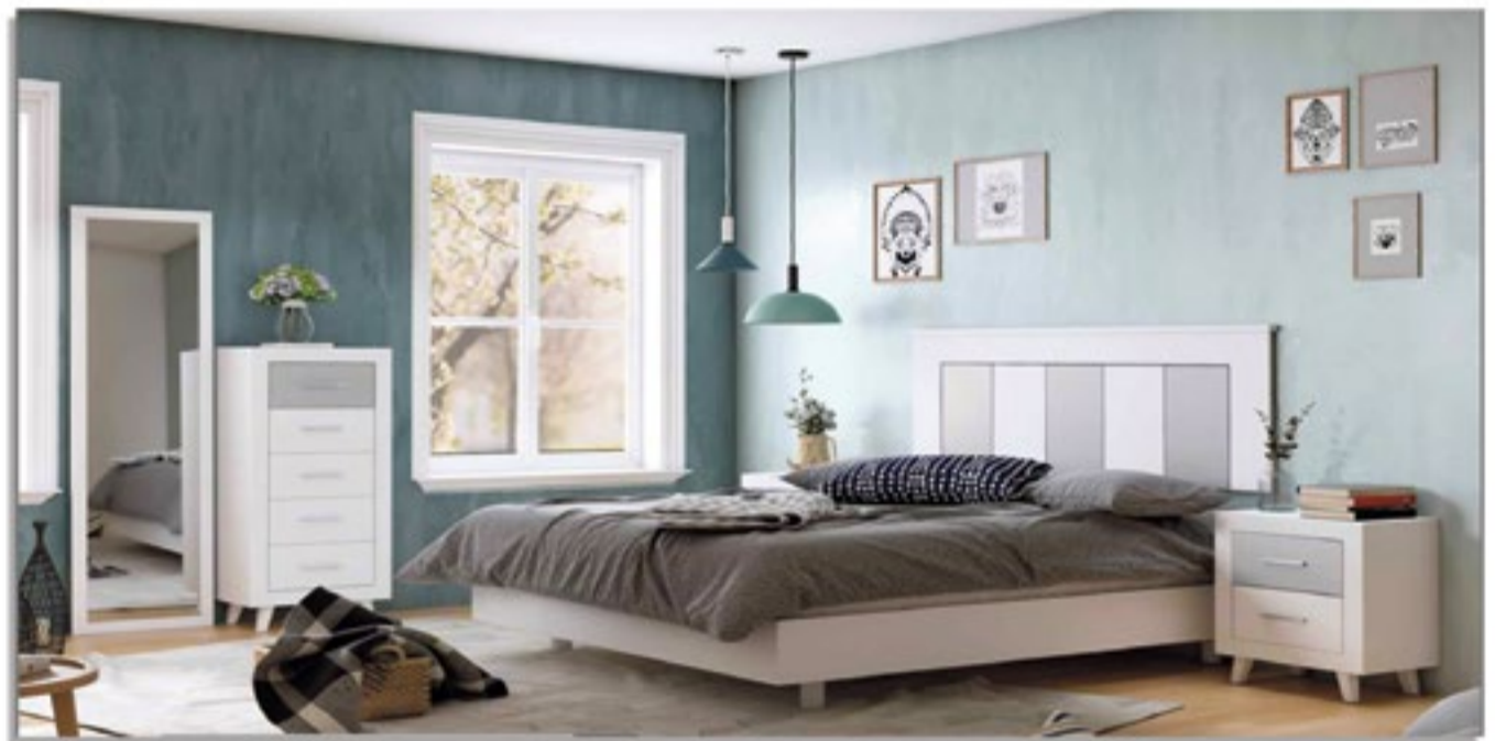
TRANSPORTE Y MONTAJE NO INCLUIDO.