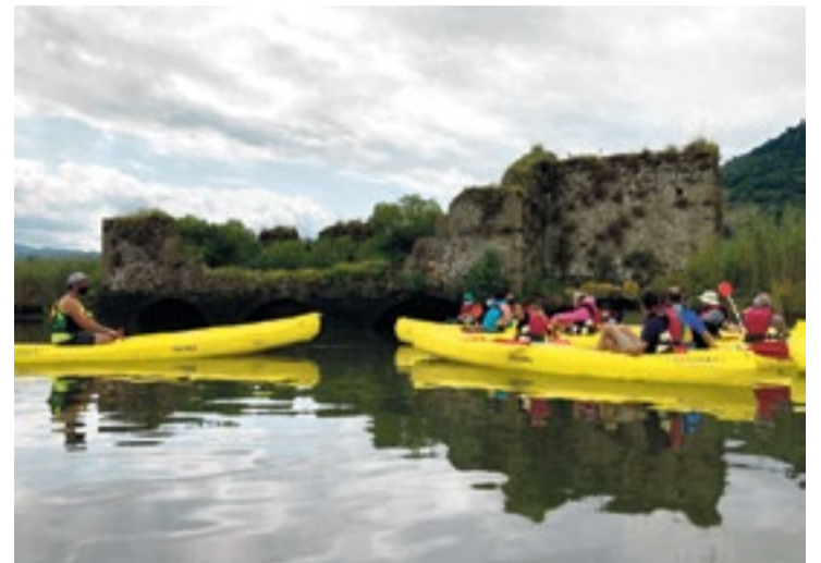
Ruta en canoa por el puerto fluvial de Limpias.

protagonistas de los primeros fotogramas del cortometraje. Los interiores se rodarán en el salón principal de "La Casa Pereda", también de principios de siglo XX.