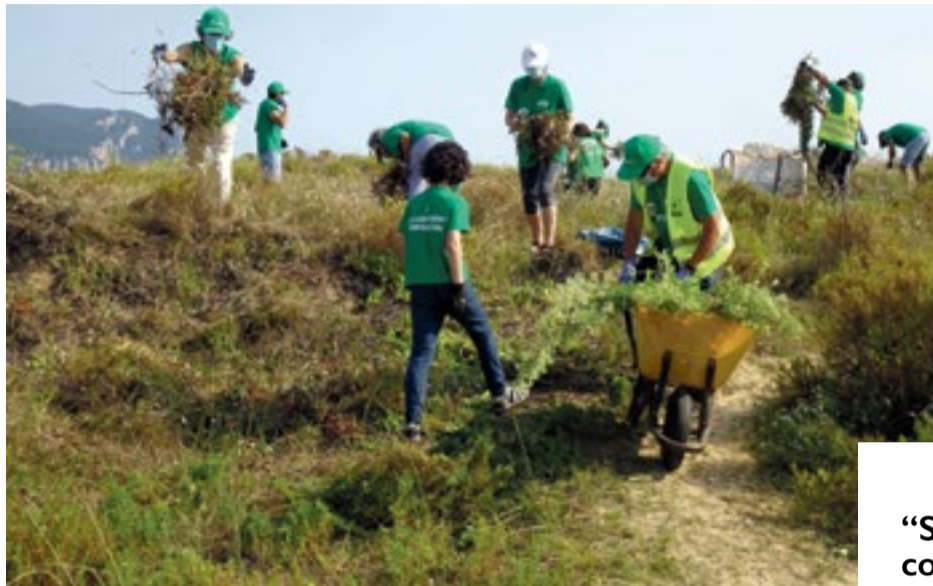
Voluntarios de la Asociación Bosques de Cantabria, eliminando las invasoras.

En el transcurso de la actividad del pasado sábado, que se llevó a cabo con la presencia del Director General del CIMA y del primer teniente alcalde del ayuntamiento de Laredo, los voluntarios tuvieron que emplearse a fondo, dada la enorme cantidad de plantas invasoras que ocupaban el tramo dunar donde se actuó. La especie objetivo, sobre la que más se incidió, fue la uña de gato ( Carpobrotus acinaciformis ), una planta crasa y rastrera, de vistosas flores rosas, originaria de sudáfrica que ha colonizado amplias